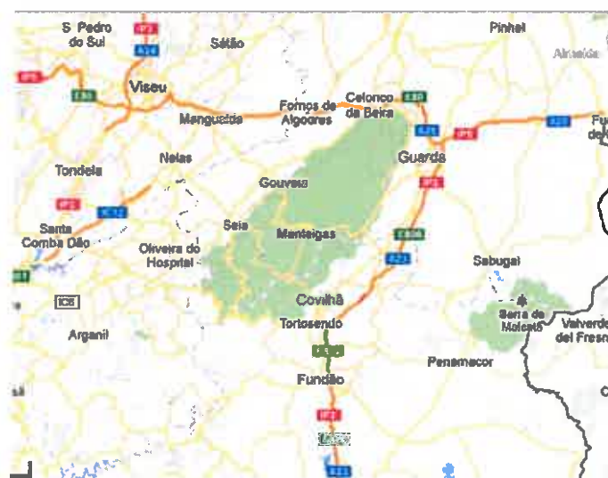
Mapa de acessos à Cidade de Gouveia

Em termos viários o concelho é atravessado pelas nacionais EN 1/ IC7, EN 232, EN 330 e EN 330-1, beneficiando ainda da proximidade à A 22, ao IC 12 ao IP 3 e A25.