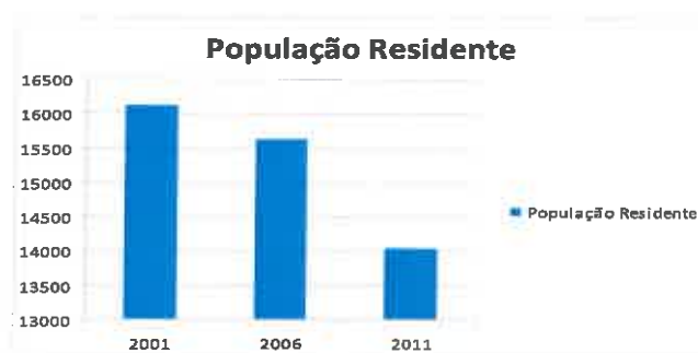
Evolução da população residente na última década

Ao analisarmos os resultados dos 3 últimos Censos feitos à população podemos confirmar a tendência para a diminuição da população residente no Concelho de Gouveia. Nesta última década a população perdeu cerca de 2000 habitantes.